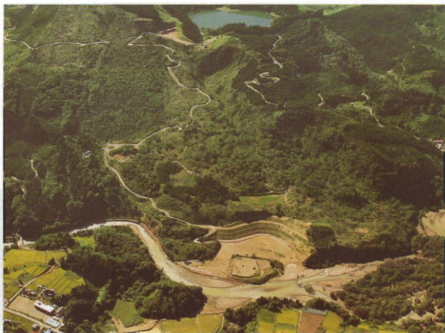
東成瀬村谷地地すべり全景