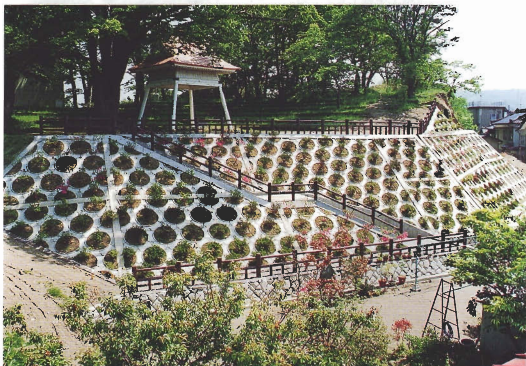
清水地区・仁賀保町