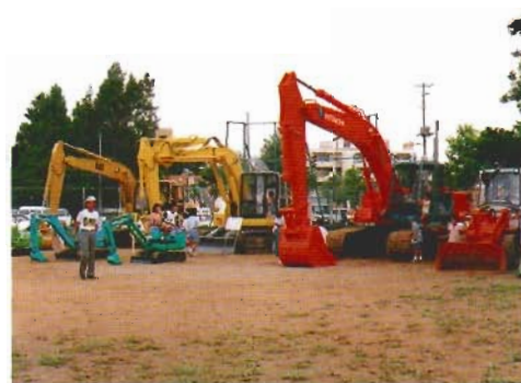
ランドアート（建設業の役割や仕事を広く県民にアピールし、業界のイメージアップを目的としたイベント）