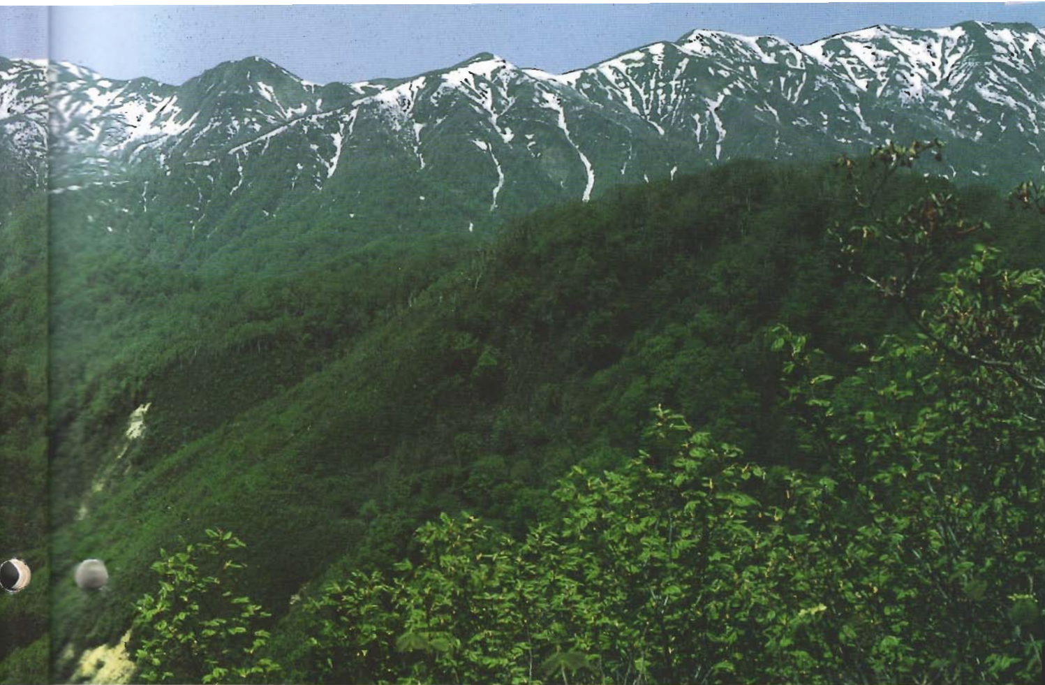
世界遺産に登録された白神山地