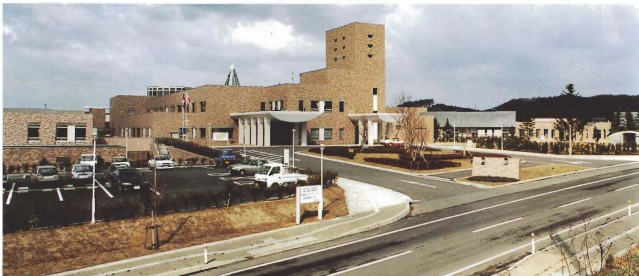
秋田県総合リハビリテーション精神医療センター

その他の業務として、建築物の評価、診断及び幼稚園、小、中、高等学校の耐力度調査や営繕工事標準単価表作成等の業務を行っている。