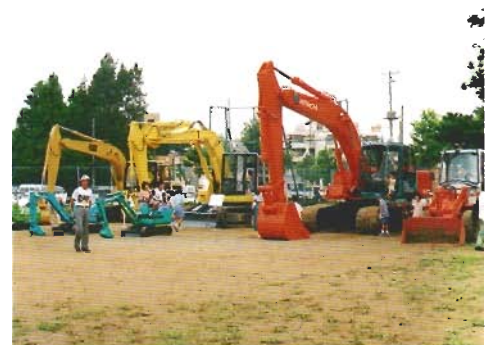
ランドアート（建設業の役割や仕事を広く県民にアピールし、業界のイメージアップを目的としたイベント）