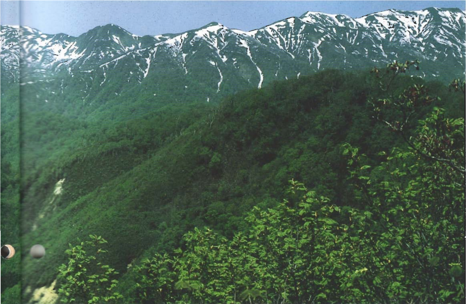
世界遺産に登録された白神山地