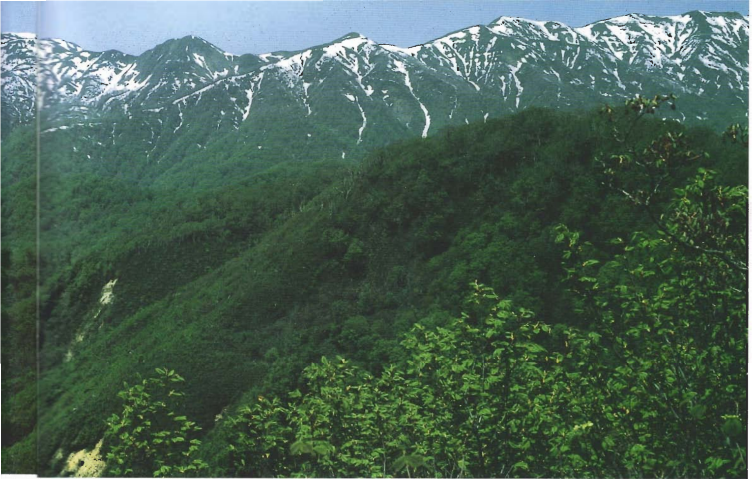
世界遺産に登録された白神山地