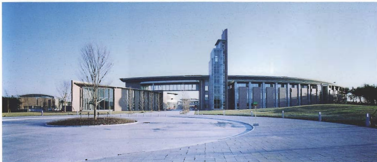
秋田県立大学本荘キャンパス