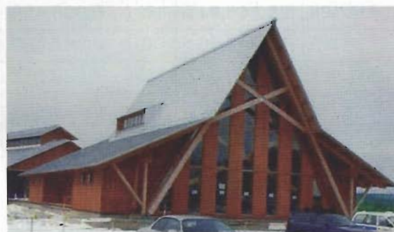
研修会議棟 (上: 外観) (下: 内観)