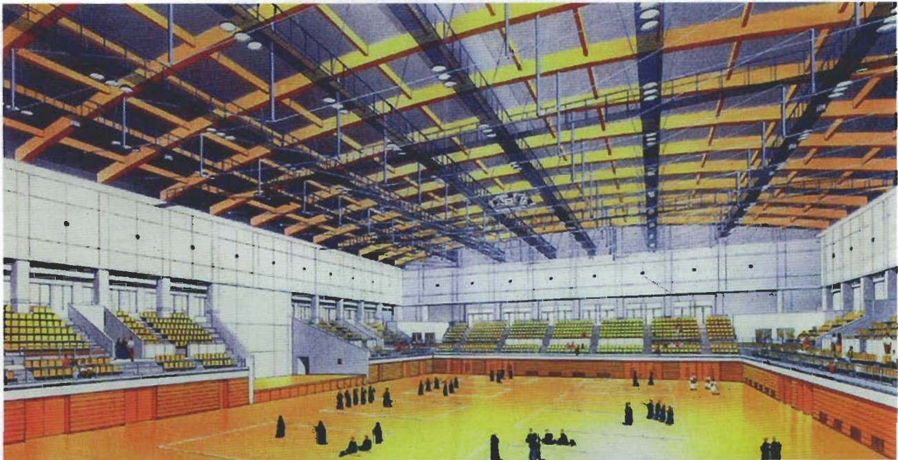
秋田県立総合武道館（仮称） 大道場内観