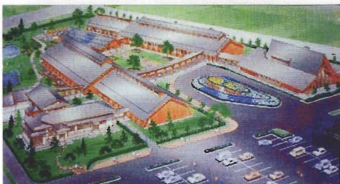
ゆとり生活創造センター (仮称)