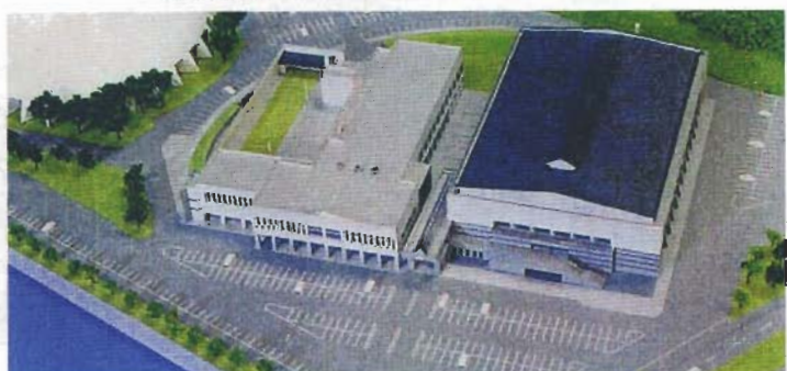
秋田県立総合武道館（仮称） 外観

大道場は大断面集成材を用いた大空間木質構造（張弦構造）を採用し、空間の緊張感と木の持つぬくもりと力強さを表現している。