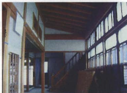
昭和初期の民家 (内部 広縁より)