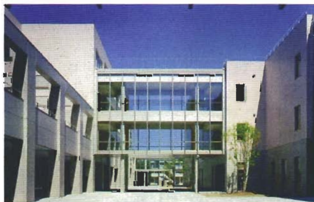
秋田北高等学校 キャンパスモール

1階はピロティー形状で各施設の入口を配置し、日常の動線は2・3階の開放的なブリッジを活用することで、キャンパスモールを中心にお互いの動きを感じられる空間構成とした。