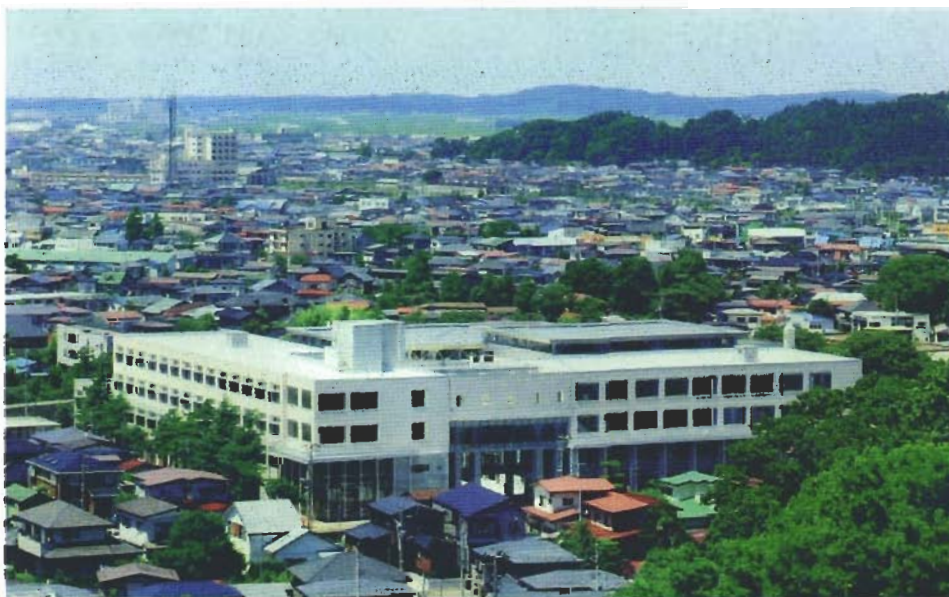
秋田北高等学校 外観（千秋公園より）

その他の業務としては、建築物の評価、診断及び幼稚園、小、中、高等学校の耐力度調査や営繕工事標準単価表作成等の業務を行っている。