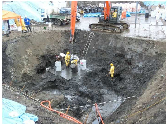
No. 2 処分場 10B