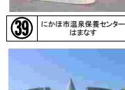
④⑩ 白瀬南極探検隊 記念館