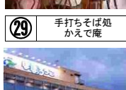
⑳⑩ はーとぽーと大内 ほぽろっこ