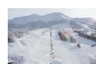
⑤⑦ たざわ湖スキー場