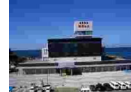
④① 道の駅象湯「ねむの丘」