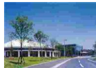
⑲ 中央地区シルバーエリア