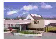
⑳⑧ にかほ市温泉保養センターはまなす