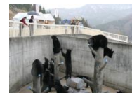
④⑤ 北秋田市くまくま園