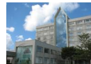
④④ ホテルサンルート大湯