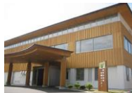
⑪ あきた白神体験センター