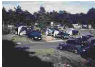
⑥ 由利高原オートキャンプ場