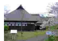
⑳⑦ 古民家食堂まがりや