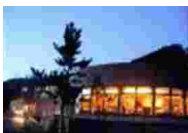
④ スパ&リゾートホテル秋の宮山荘