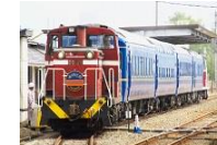
⑤⑥ 小坂鉄道レールパーク