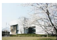
⑮⑧ スポーツ科学センター