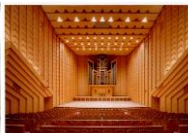
⑳⑤ アトリオン音楽ホール