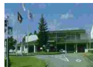
⑳② 南部シルバーエリア