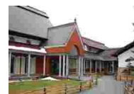
⑳④ 仙台市立榊細工伝承館ふるさとセンター