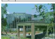
⑮⑩ 北部シルバーエリア