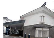
⑳⑥ 仙北総合情報センターイベント交流館新瀬社記念文字館