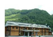
④⑦ 奥の湯 森山荘