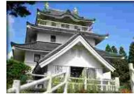
⑳ 森林資料館五城目城