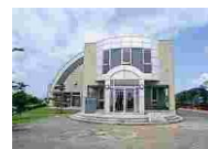
⑳③ 八郎潟町オリンピック記念会館