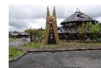
⑤⑧ なまはげオートキャンプ場