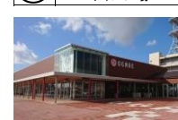
⑤⑨ 道の駅おがオガレ