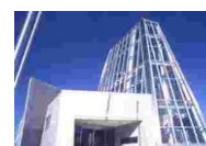
④③ フェライト子ども科学館