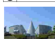
⑳⑨ 白瀬南極探検隊記念館