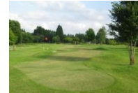
⑤① 県立北欧の杜公園