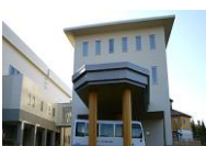
⑮⑦ 田沢湖スポーツセンター