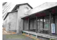
⑳⑤ 仙台市立角館町平福記念美術館