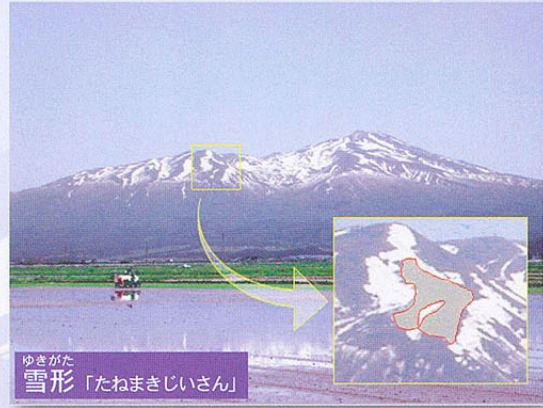
ゆきがた雪形「たねまきじいさん」