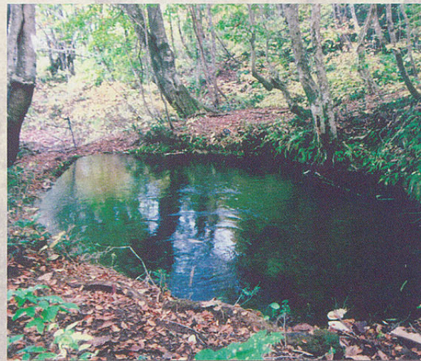
ししがはなじけん 獅子ヶ鼻湿原