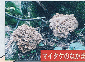
マイタケのなかま