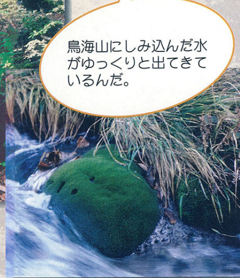
チョウカイマリモ