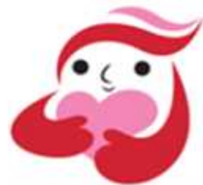
犯罪被害者等支援シンボルマーク 「ギユっとちゃん」