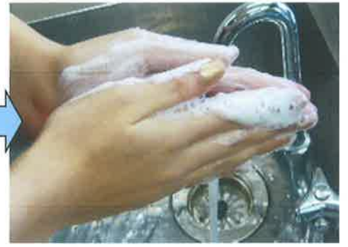
③ あわをたてながら、手のひらをよくこすります