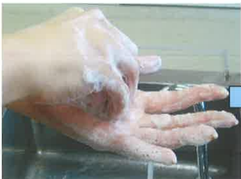
⑦ ゆびさき 指先もよくこすります