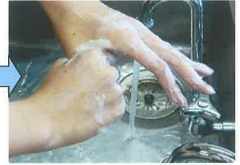
⑥ おやゆび 親指もあらいます