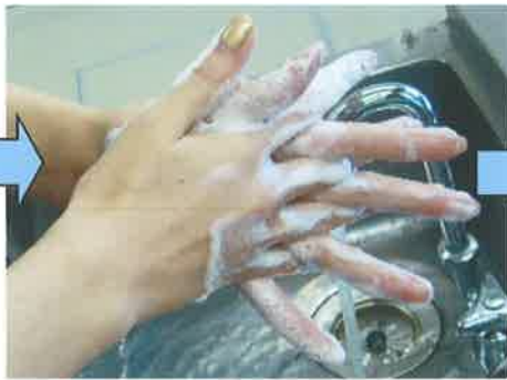
⑤ ゆび あいだ 指の間をあらいます