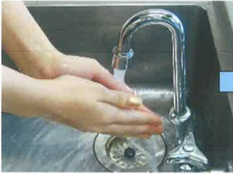
① みず 水で手をぬらし、