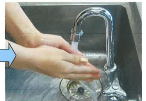
⑨ みず 水でよくあらい流します