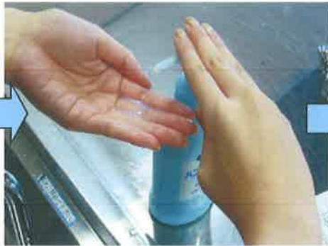
② せっけん 石けんをつけます