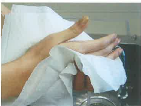
⑩ きれいなハンカチやペーパータオルでふきます