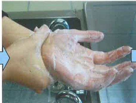
⑧ てくび わす 手首も忘れずに