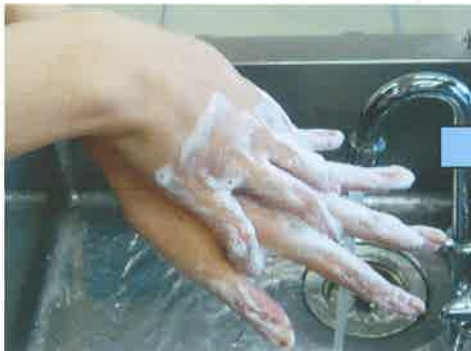
④ こう 手の甲をこすります