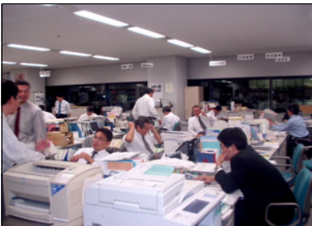
生涯学習課の様子・11月

なお、財源が捻出できない場合であっても、例えば、まずは、市町村内のいくつかの小学校区のみでモデル的に開始すること、従来行ってきた公民館等における週末の社会教育事業をリニューアルすること、母親ボランティア等の活用により、財政的負担を軽減すること、等の様々な方法があります。何か先進的事例をご紹介できる可能性もあるので、当課にもお気軽にご相談下さい。