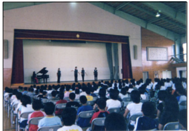
八竜中学校に小学生も集合

今回ご紹介するのは、三種町の取り組みです。三種町では、教育委員会の事業として青少年劇場を実施しており、今年度も町内の3カ所で開催しました。特に八竜地区の3校(浜口小・湖北小・八竜中)では、10年以上にわたって3校で共同開催しており、今回も八竜中学校を会場に音楽を鑑賞しました。小学校と中学校の共同開催は、年齢の幅が広がることから作品の選定が難しいという課題はありますが、学校間での交流という面で教育的効果が見られます。