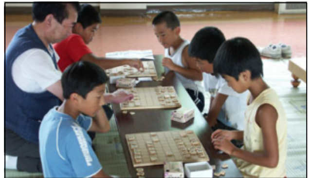
上：伝承遊び(将棋教室) 下：体験教室(火おこし)

能代市二ツ井公民館では、平成15年度、市日の開催日(0と5がつく日)と土曜日が重なる日に館内のロビーに伝承遊びができる「市日交流サロン」のコーナーを設け、市に買い物に来た住民と児童生徒の随時交流を行いました。