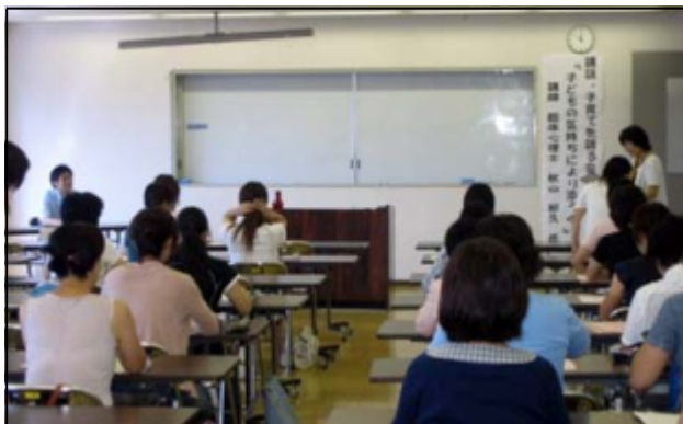
パパママキッズゼミの様子

『生涯学習の仕事に関わってから5ヶ月たちましたが、大変学ぶことが多いです。これからも広い視野で生涯学習に携わっていきたいです。』