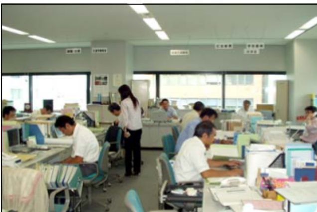
生涯学習課の様子

これらの事情を打破すべく、今後の展望を次号以降で具体的に考えていきたいと思いません。今後とも、宜しくご覧下さい。