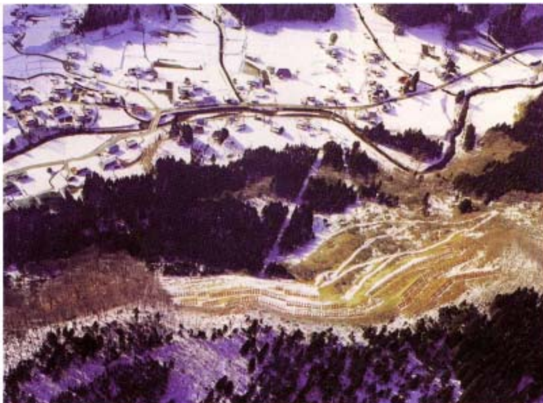
(横手市(旧増田町)・上畑地区)