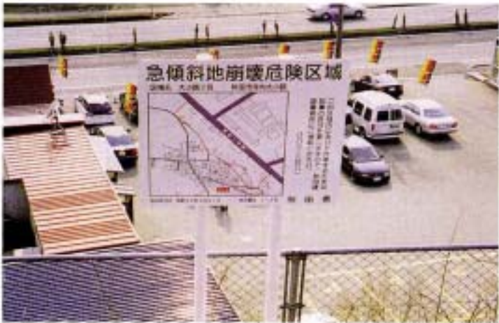
急傾斜地崩壊危険区域指定標識