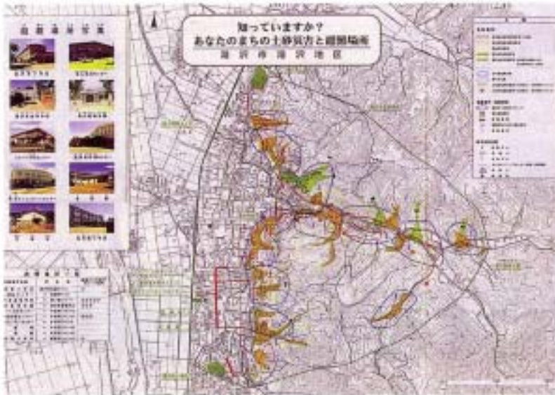
(危険箇所を住民に周知するために作成した土砂災害危険箇所マップ 湯沢市)

土砂災害を防止するため砂防堰堤などの整備を促進するとともに、人命を守るため土砂災害危険箇所マップの作成配布による住民への危険箇所の周知を実施します。また、雨量観測局を県内全域に設置し警戒や避難のための基準雨量を設定したり、情報通報システムのひとつとして雨量情報表示板を設置するなど総合的な土砂災害対策を推進します。