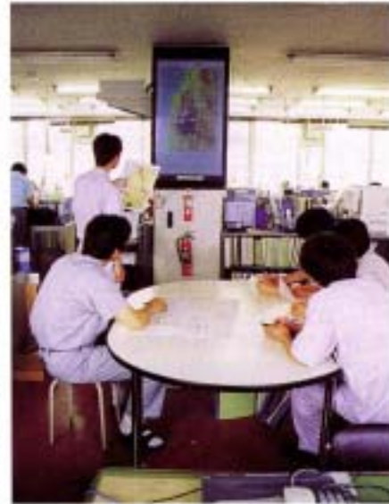
(管内の雨量情報を表示する 砂防情報システム 由利地域振興局建設部)