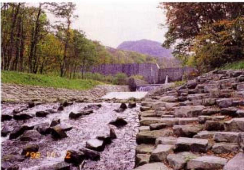
(十和田・八幡平国立公園内にある土石流危険溪流で景観に配慮し施工した砂防堰堤工と護岸工 大川岱・小坂町)

火山区域などは荒廃が著しく砂防堰堤などの整備を促進するとともに、鳥海山では噴火による火山泥流や土石流の防災マップを作成しています。また火山区域は、自然が豊かで景観に優れた箇所が多いため、砂防堰堤や流路工も景観などに配慮しながら整備しています。