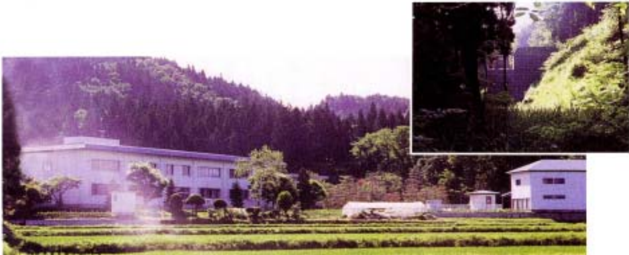
(災害弱者施設(病院)を保全する砂防堰堤 たつみ沢・大館市)

土石流・がけ崩れ・地すべりなどの土砂災害の犠牲となりやすい高齢者、幼児、障害者など、いわゆる災害弱者の人々に関連した病院、幼稚園、老人ホームなどの施設を守るため、砂防事業ではこれらの施設がある土石流危険渓流を重点的に整備しています。