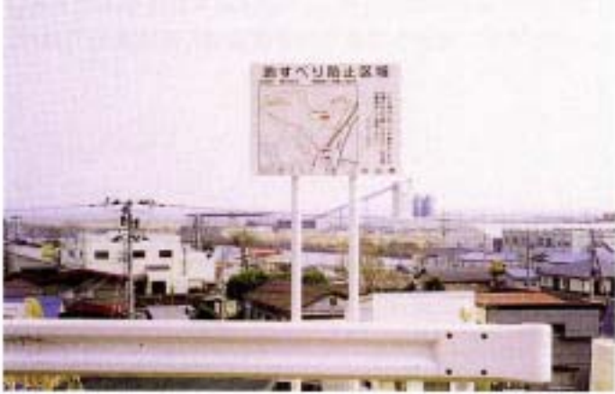
地すべり防止区域指定標識

最近の開発事業の進展に伴い、これら土地の管理は、非常に重要な役割を果たしています。