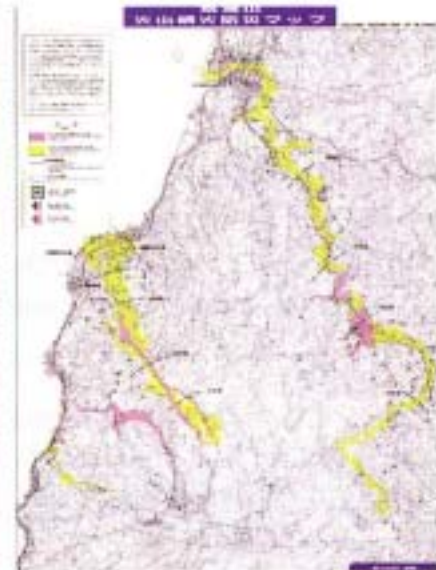
(警戒避難のために公表した火山泥流・土石流に対応した火山噴火防災マップ 鳥海山)