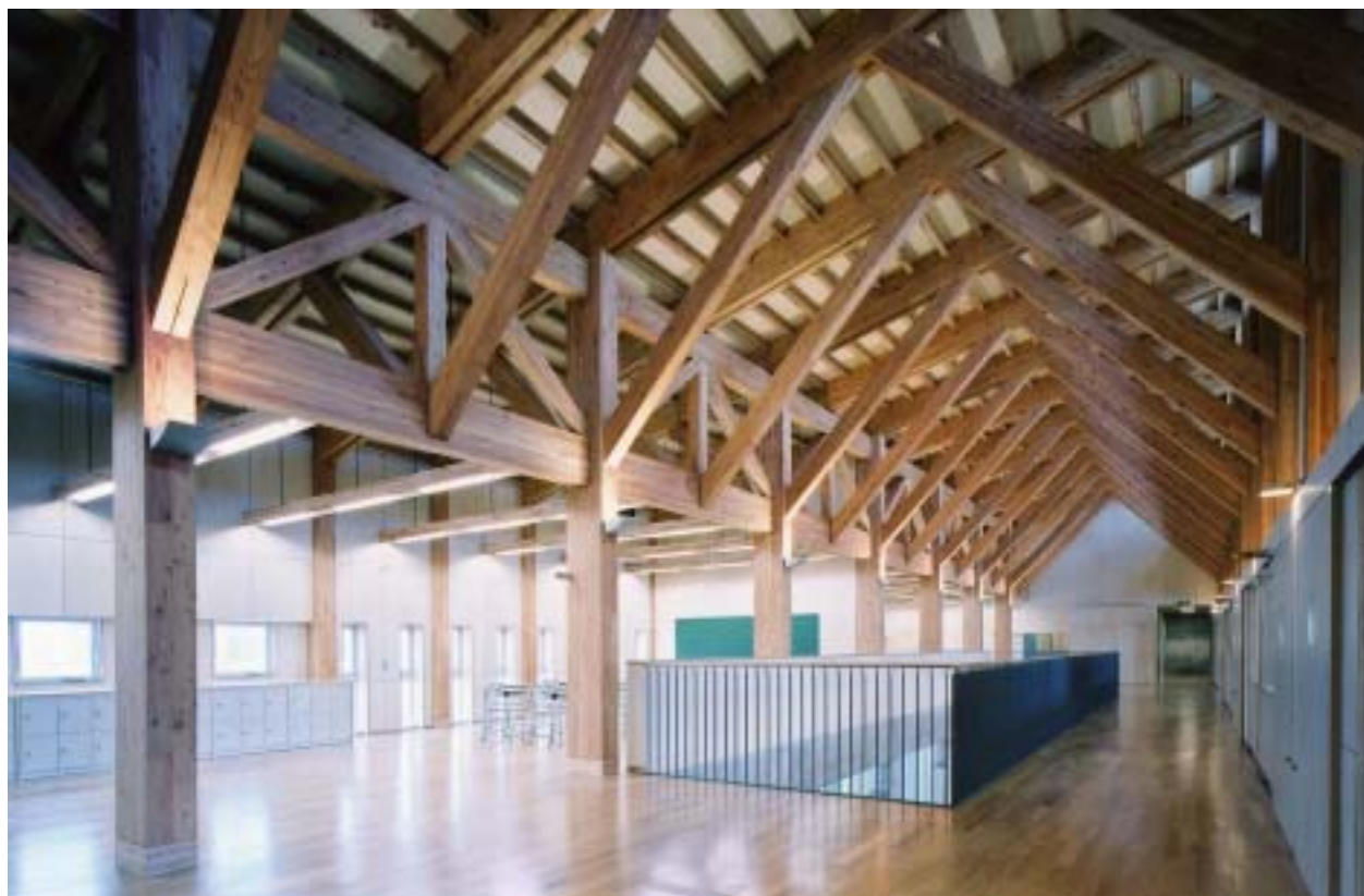
秋田県立清陵学院中学校 高等学校 南棟共用部