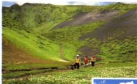
駒ヶ岳とチングルマ

本県は、全国で6番目という広い面積を持ち、春の新緑、夏の空と海の青さ、秋の紅葉、冬の雪景といった色彩感あふれる四季の変化に富んだ自然を誇り、その息吹を身近に感じながら生活することができます。