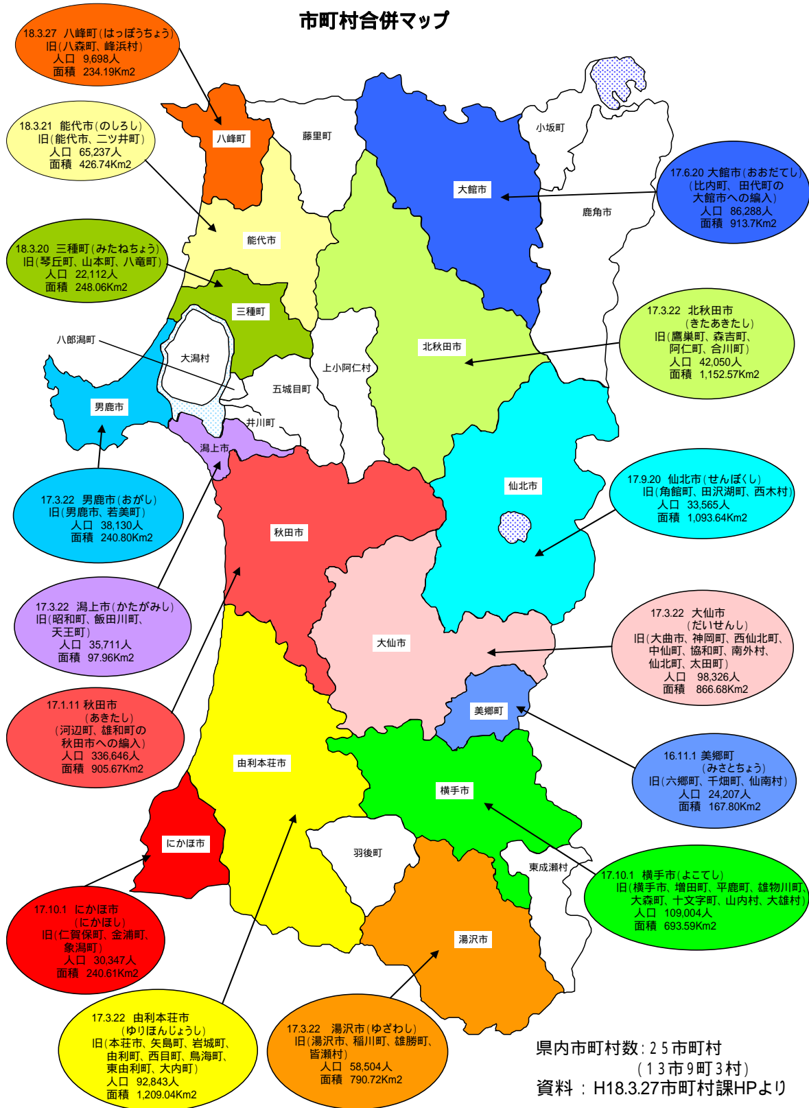
秋田県市町村区域図

本県の総面積は約11,612km 2 、全国第6位で、東京都、埼玉県、千葉県の合計を上回ります。また、比較的大きな各市町村の面積規模が、市町村合併によりさらに大きくなり、由利本荘市と北秋田市の合計だけで東京都や沖縄県を上回り、神奈川県にほぼ等しい面積になります。