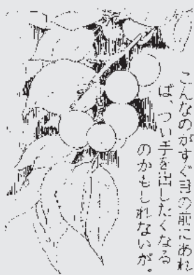
たわねに笑った青い梅の実。こんなのがすぐ目の前にあれば、つい手を出したくなるのかもしれないが。

おもしろい看板を見つけた。「梅の実をとらないでください」。場所は秋田市浜田にある梅林園だ。 この梅林園は昭和四十四年、市政八十年を記念してつくられたもので面積は六ヘクタール。その中の三分の一に梅を主体に桃や杏が植えられている。色とりどりに咲き誇る花を愛でるための公園だが、中には立派な実をつける木々もある。これが問題の種だ。市民の憩いのための公園だが、梅の実が秋田市のもの。誰が採ってもいいというものではない。梅の実の行き先を聞いてみた。