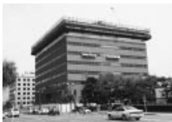
来年4月にオープン予定の県庁第二庁舎

高度情報化に対応する拠点として第二庁舎内にネットワーク活用ルームやOALーム等を整備し、情報センター機能を構築します。