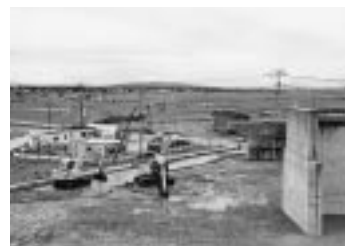
着々と工事が進む県道男鹿昭和飯田川線

県道男鹿昭和飯田川線の整備を図るとともに、安全な交通を確保するため道路の補修を積極的に推進します。