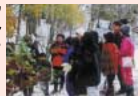
春を探しに出掛けてみませんか?