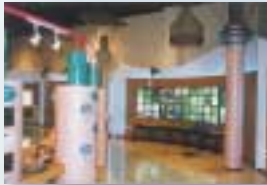
水と川のミュージアム