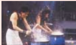
NANTA(セリフのほとんどないステージパフォーマンス)