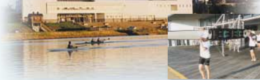
アクアパルと鳥海山をバックにボートの練習風景