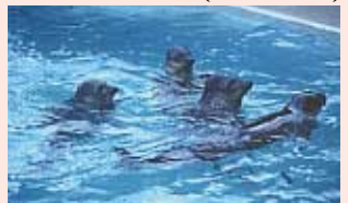
ゴマちゃん(ゴマファザシ)