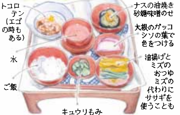
トコロテン(エゴモある) 水 ご飯