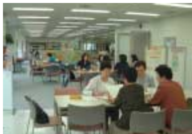
秋田市の男女共同参画センターでの活動の様子

月～金 午前9時～午後9時 土・日・休日 午前9時～午後5時 休館日 12月29日～1月3日