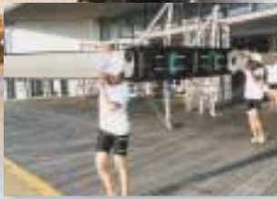
軽々と艇庫からボートを運び出す本荘南中ボート部員

夕刻になると「キャッチ！キャッチ！」とボートのかけ声が響く。本荘市の中心部を流れる子吉川では、ボートを漕ぐ姿が、見慣れた風景として市民の生活に溶け込んでいます。