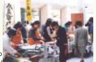
昨年開催の「森から始まる食のバザール」