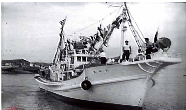
11月3日(月・祝)上映「二代目千秋丸」より

八月の上映会では、国民文化祭にちなみ、伝統工芸や生活文化など秋田の文化に関する話題を始めとした五本の作品を上映しました。