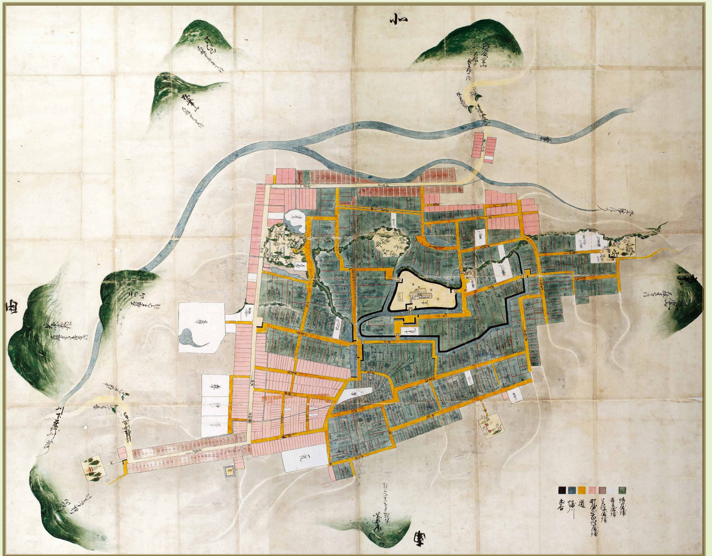
大館絵図(県C-190、141cm×178cm、享保13年)