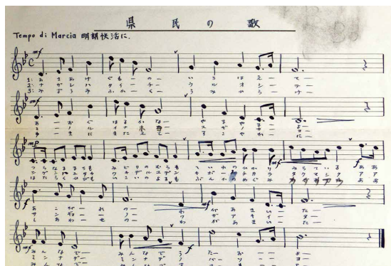
「県民の歌」楽曲公募の当選作品

これに対し、戦後の「県民の歌」については、昭和三十五年「県民の歌・県旗・県章関係綴」（資料番号九三〇一〇三―三五〇）があります。一冊の中に、「県民の歌」等