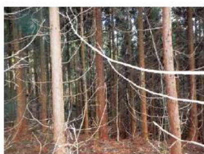
生育の思わしくないスギ人工林