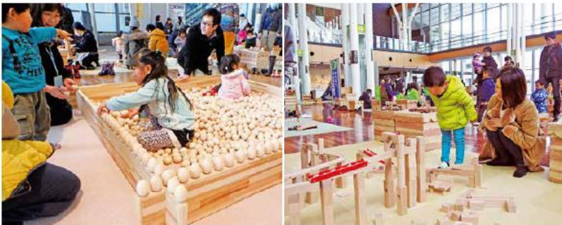
木育空間の整備イメージ(冬の森林祭)