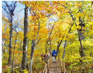
木道の整備(八峰町)