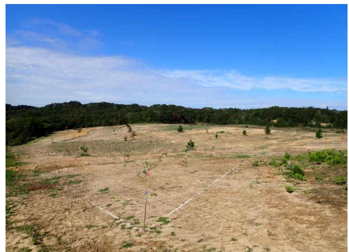
植栽後の状況(大仙市)