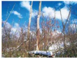
松くい虫被害を受けて枯れたマツ林