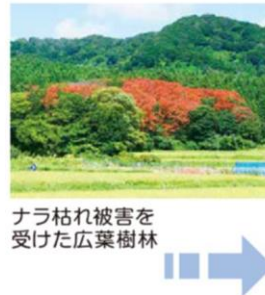
ナラ枯れ被害を受けた広葉樹林