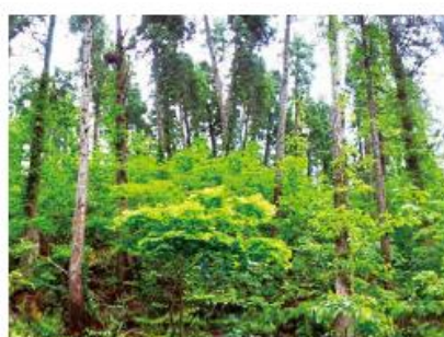
針葉樹と広葉樹の混交林へ誘導