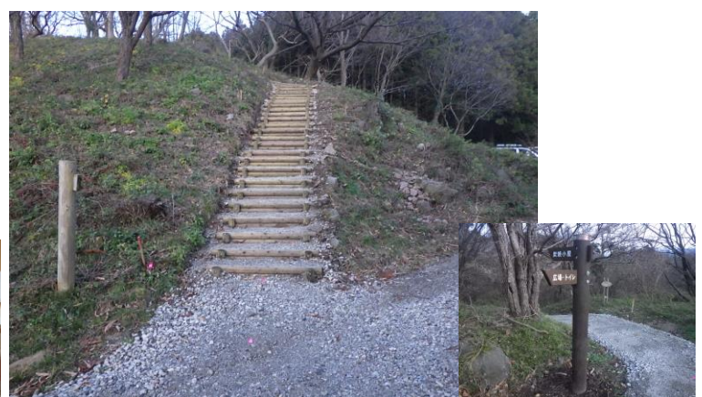
歩道・案内標識整備(にかほ市 芭蕉の森公園)