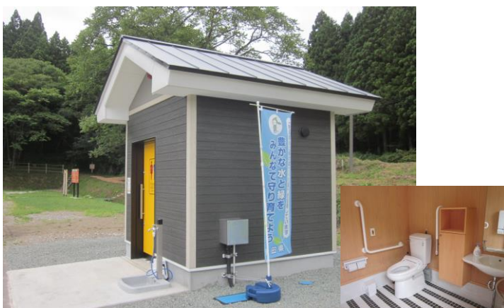
トイレ整備(由利本荘市 あゆの森公園)