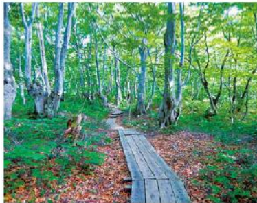
木道の整備(にかほ市)