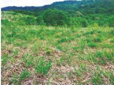
自然再生が困難な放牧跡地