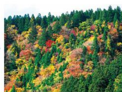
将来の姿(イメージ)