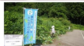
作業中(税事業PRのぼり)