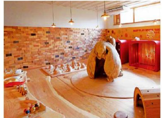
鳥海山木のおもちゃ美術館