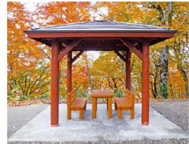
休憩施設整備(湯沢市)