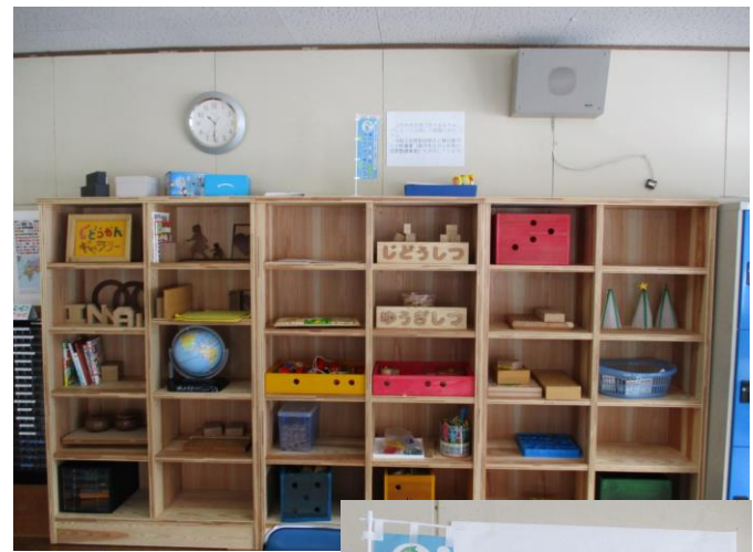
整備の状況(湯沢市 院内地区センター)