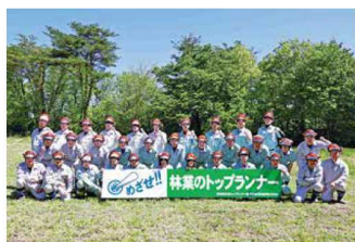
秋田林業大学校の研修生