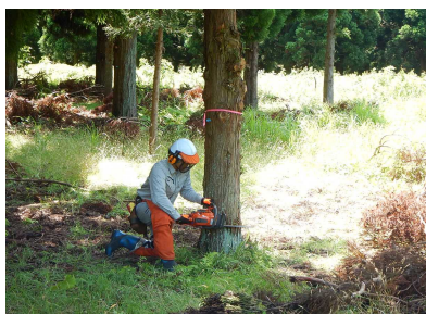
チェーンソー実技研修