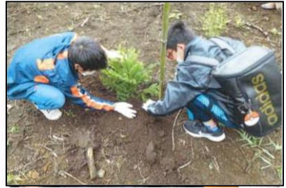
「秋田杉で街づくり」ネットワークによる植樹活動