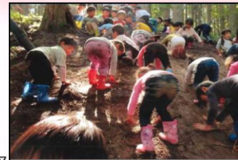
幼児期における森林体験 (日新保育園)