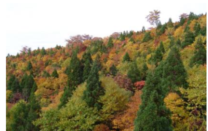
将来の姿（イメージ）