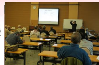
サポートセンターによる森林ボランティア に対する技術研修会の開催