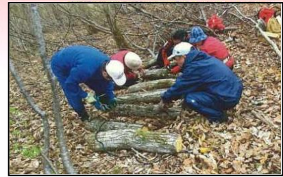
「森人の会」による植菌活動