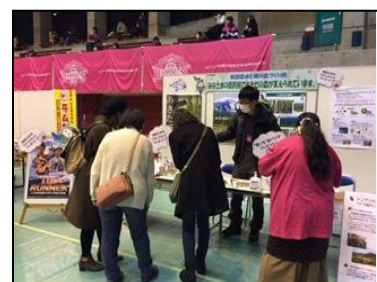
秋田ノーザンハピネットの試合会場で 「水と緑の税」PRブース出展(秋田市立体育館)