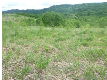
自然再生が困難な放牧跡地