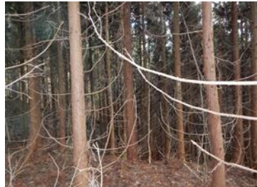
生育の悪いスギ人工林