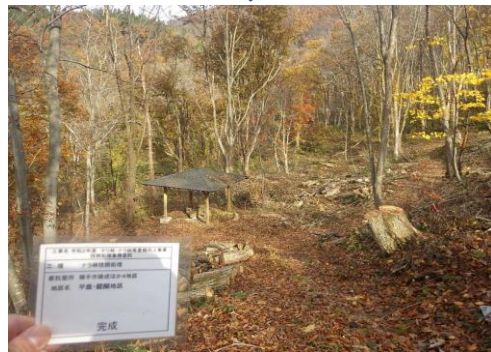
横手市 ナラ 整備後