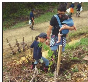
木イベント開催(大館市) (大葛地区青若会)