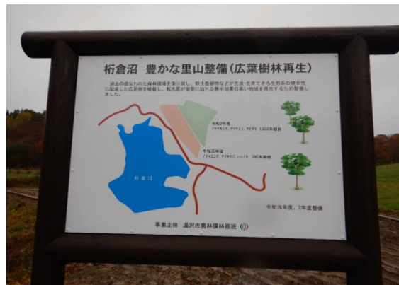
湯沢市 整備後 (標識設置)