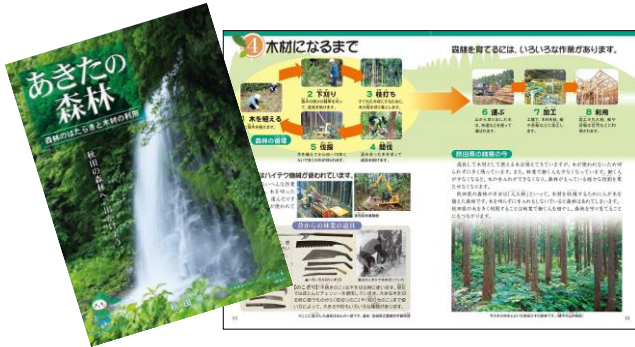
副読本「あきたの森林」