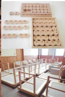
(木製積み木、台車の整備)