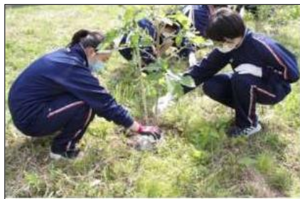
中学生による保育活動(施肥)（男鹿市）