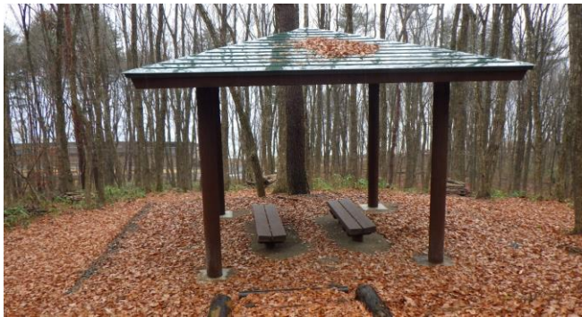
仙北市 大沢地区森林公園 (東屋の整備)