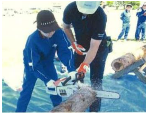
森林・林業体験学習(山田小)