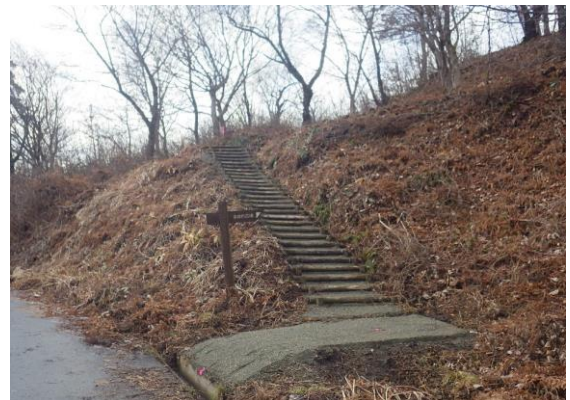
大仙市 八乙女公園 (歩道の整備)