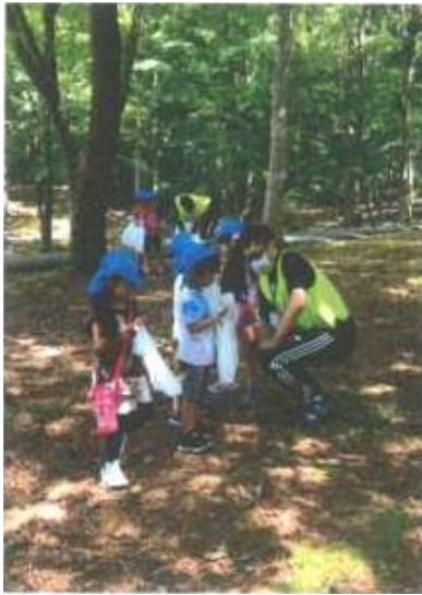
自然観察会(サン・パティオこども園)