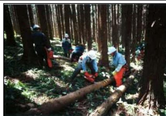
薪づくり体験(能代市) (ニツ井宝の森林プロジェクト 実行委員会)