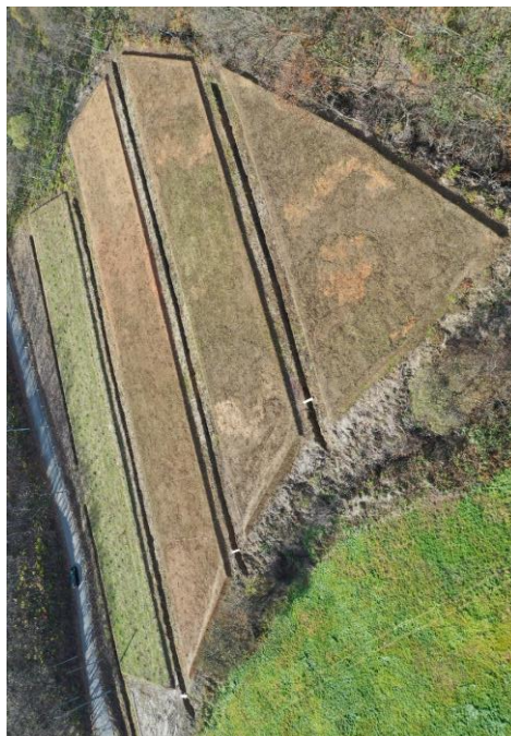
湯沢市 整備後 (ドローン撮影)