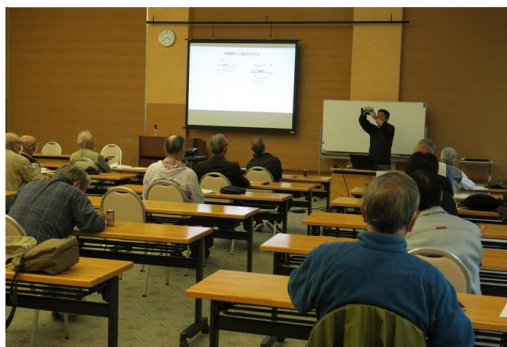
森林ボランティア技術研修会 (講演会及び技術研修(チェーンソー))

森林ボランティアの育成や指導者の派遣、活動資材の貸与、WEBサイト等による情報発信、研修会の開催、森林ボランティア団体への技術指導や事務指導を実施。