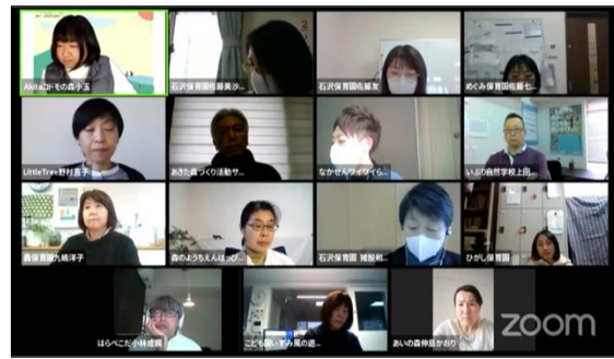
「森のようちえん 野外・自然保育基礎研修」 コロナ禍でも、のびのびと外遊びを行う方法等、未就学児 に対する専門的な技術を学ぶ研修会 (オンライン研修会)

・森のようちえん 野外・自然保育基礎研修(80名参加、YouTube再生回数438回)