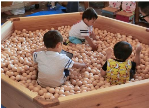
北秋田市 北秋田市民ふれあいプラザ