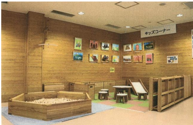
秋田市 大森山動物園ピジターセンター(木のボール、滑り台、キッズテーブル&チェア、絵本棚の整備)