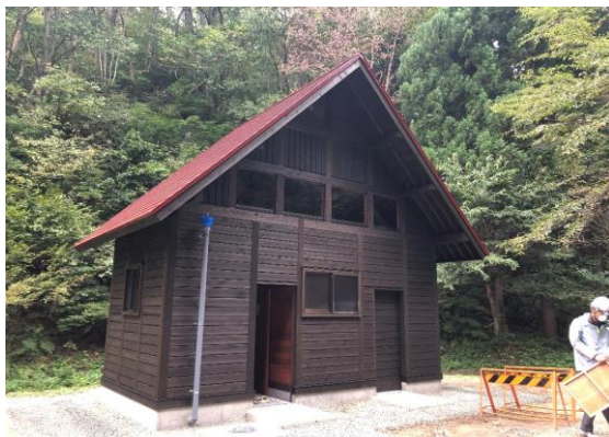
横手市 横手いこいの森 (公衆トイレの整備)