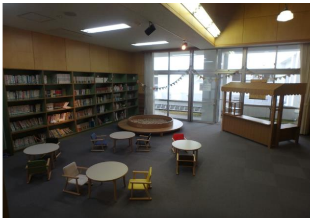
湯沢市 雄勝スポーツセンター(木のボール、屋台、キッズテーブル&チェア、玩具の整備)