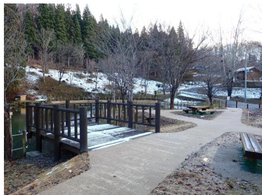
湯沢市 湯沢市民の森 (ウッドデッキ・遊歩道の整備)