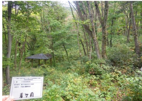
横手市 ナラ 整備前