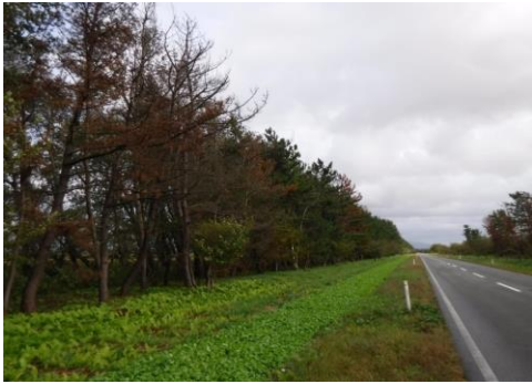
大湯村 マツ 整備前

調査面積計 1)+2) 570.78 ha 伐倒面積計 3)+4) 646.99 ha 伐倒材積計 3)+4) ( 9,890.97 m3 )