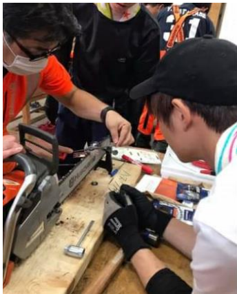
チェーンソー目立て実習