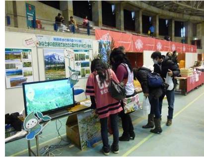
ハピネッツ試合会場で「水と緑の税」PRブース出典