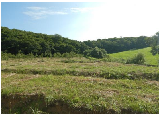
湯沢市 整備前 (下刈後・植栽前)