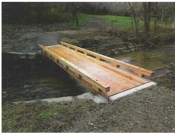
大館市 岩神ふれあいの森 (橋の整備)