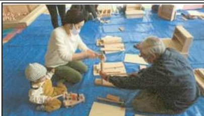
木育イベントの開催(大館市) (アミュージングサポート「あ☆そ☆ぶ」)