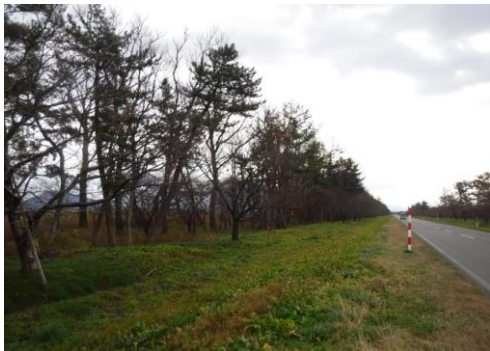
大湯村 マツ 整備後