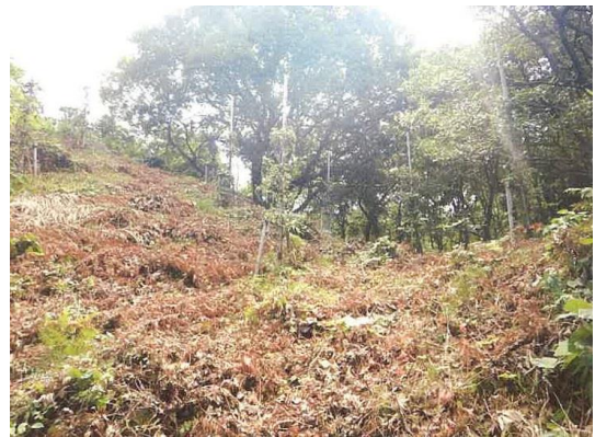
にかほ市 芭蕉の森公園 (修景施業:下刈り)