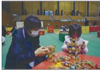
木育イベントの開催（大館市）