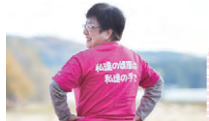
「私たちの健康は私たちの手で」が活動のスローガン