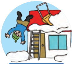
屋根やはしごからの 転落