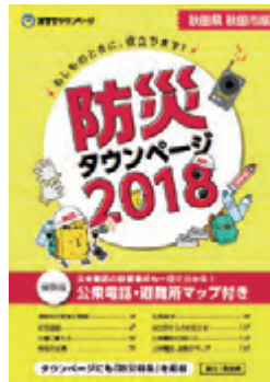
図 県総合防災課 ☎018(860)4563

県とNTTタウンページは、軽量でコンパクトな「防災タウンページ」を作成し、今年8月に全戸配布しました。防災情報や県内市町村の避難所等マップを掲載しておりますので、平時および災害時にご活用ください。