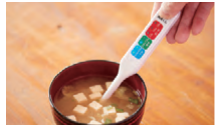
塩分濃度を測定し、減塩のきっかけにします

大館市出身。 平成20年、大館市内比内地区に設立された食生活改善推進協議会の会長に就任。平成29年から秋田県食生活改善推進協議会の副会長。