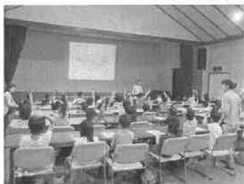
<園長先生のクマ講座>