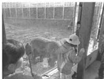
<ガラス越しのエサやり体験>