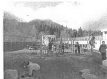
<運動場でのエサ隠し>