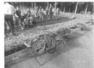
<サツマイモ収穫風景>