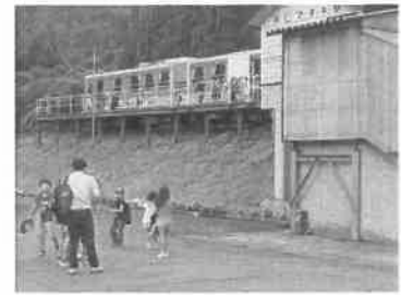
<阿仁マタギ駅到着>