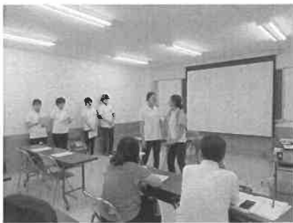
【実習生による寸劇(8.24)】