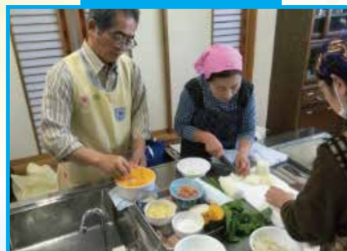
エコ・クッキングの開催