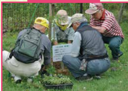
大森山動物園の清掃と植樹