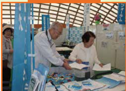
大館市エコフェアに出展