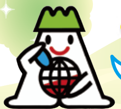
秋田県地球温暖化防止マスコットキャラクター