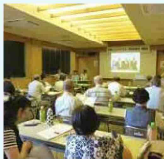
地球温暖化防止に関する講演会

【エコ・クッキングとは】身近な食生活からはじめるエコ活動。環境を思いやりながら、「買い物」「調理」「食事」「片づけ」をすることです。