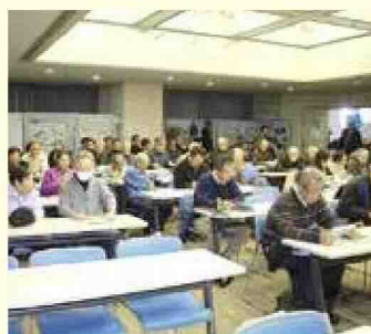
地球温暖化防止に関する講演会

※これ以外にも今後、能代山本支部の「講演会」や県北協議会の「施設見学&講演会」も予定しています。詳しくは事務局にお問い合わせください。