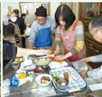
地元の食材でエコ・クッキング