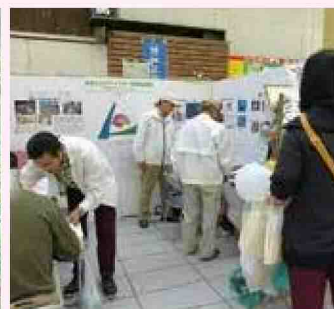
エコ&リサイクルフェスティバル出展

各協議会では、他にも様々な活動をしているよ！一般の方も参加可能なので、どんどん参加してねー！