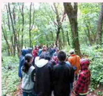
里山エコの森づくり