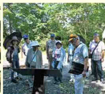
伊勢堂岱遺跡の見学