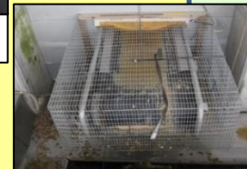
集卵・除糞ベルトの開口部の隙間対策