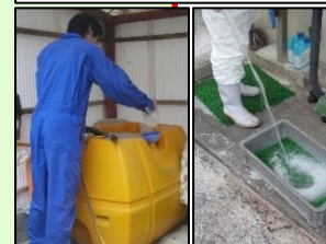
消毒液の定期的交換