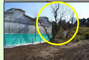
家きん舎周囲の樹木の剪定