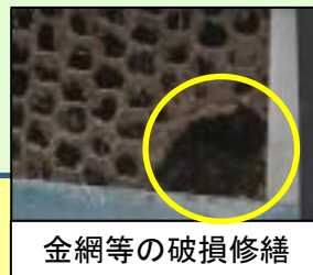
金網等の破損修繕