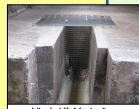
排水溝等からの侵入防止対策 (鉄格子の設置)