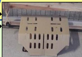
ねずみ対策 (トラップ設置)