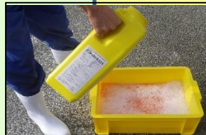
家きん舎毎の消毒