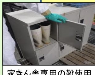
家きん舎専用の靴使用