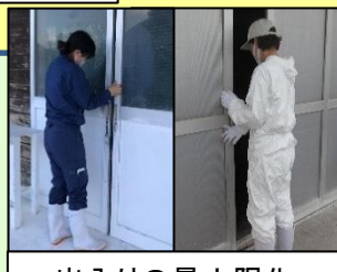
出入りの最小限化