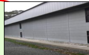
家きん舎周辺の整理・整頓