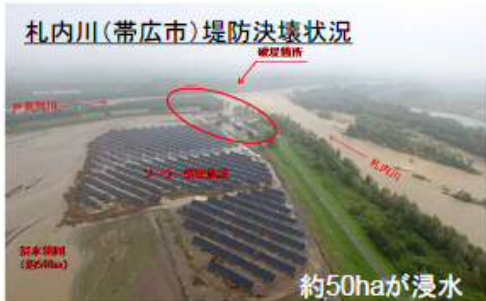
ソーラー発電施設に流木が堆積した様子