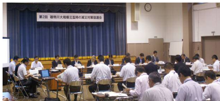
雄物川協議会の開催状況（平成28年8月9日）