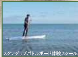
スタンダップパドルボード体験スクール