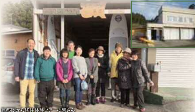
首都圏から移住体験ツアーの皆さん