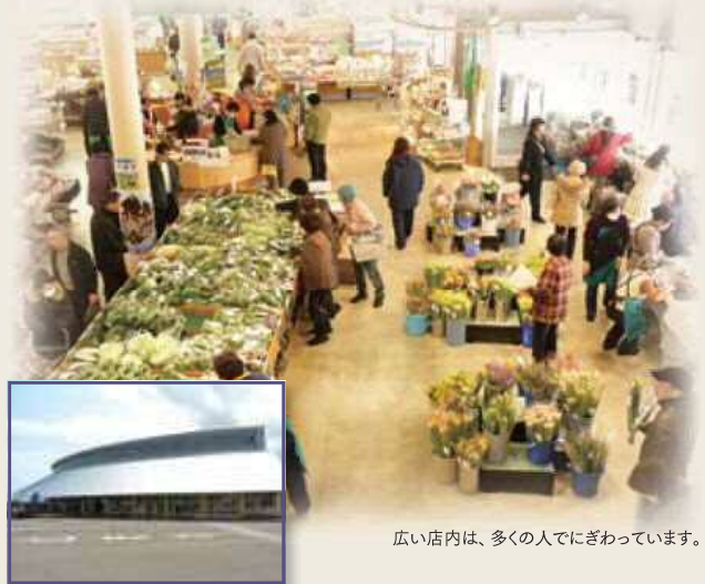
広い店内は、多くの人でにぎわっています。