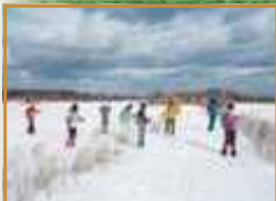
冬の運動不足解消にクロスカントリースキー