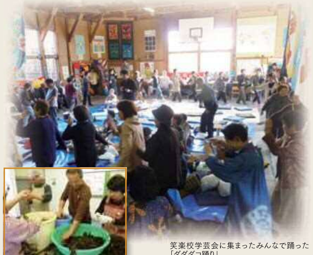
塩わかめ作り体験