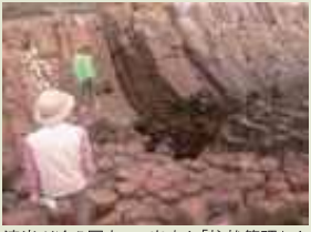
溶岩が冷え固まって出来た「柱状節理」!

◎ジオツアーガイド料 海岸コース (所要時間2時間) 4,000円 柱状節理・ブラックサンドビーチほか