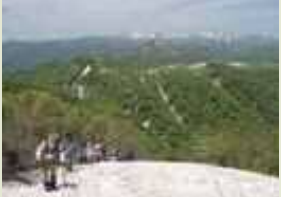
世界遺産白神山地ニッ森登山

ニッ森登山コース (所要時間4時間) 8,000円 白神山地の成り立ちや、地質、植生などをガイドします。