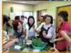
伝統料理(笹巻き)作り体験