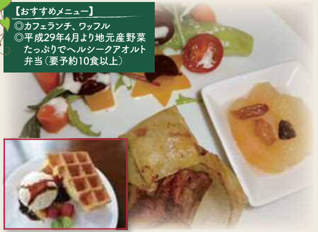
当店おすすめのワッフル