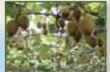
民宿のすぐ近くにあるキウイ園。 無農薬にこだわり自信を持って 提供している。