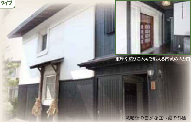
重厚な造りで人々を迎える内蔵の入り口

体験 田舎料理を食べながら、ノスタルジックな昔風情に浸る内蔵の宿 Map 5 別棟タイプ