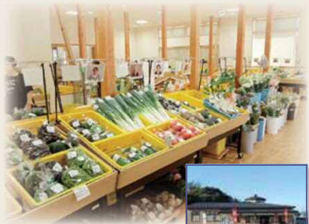
道の駅の建物は小町の旅姿である、「市女笠(いちめがさ)」をモチーフにデザインされています。

〒019-0205 湯沢市小野字二ツ森149-2 (道の駅「おがち」隣接) ☎0183-52-5525 ☎0183-52-5566 営業時間 9:00～18:00(11月～6月は17:00まで) 定休日 なし 駐車場 店舗前のほか道の駅駐車場もご利用できます。普通車108台、大型車12台、障害者用2台、トレーラー1台