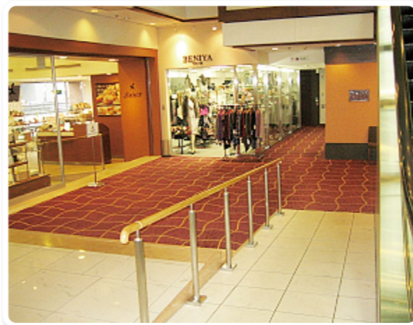
ホテル内のスロープ