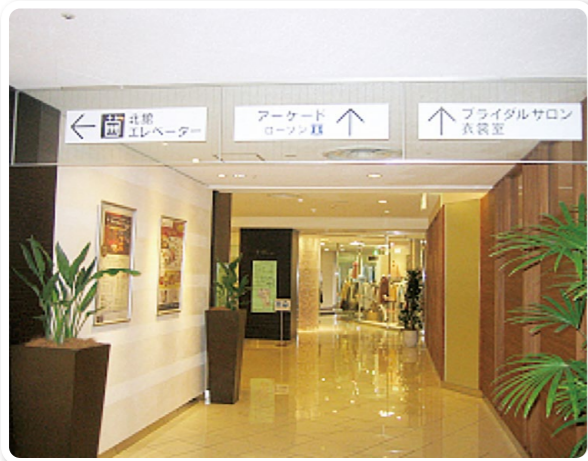
ホテル内のサイン表示