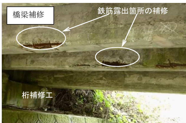
国道103号 白沢橋工区（鹿角市）