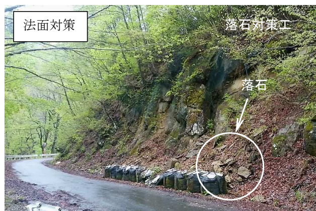
比内森吉線 森吉工区（北秋田市）