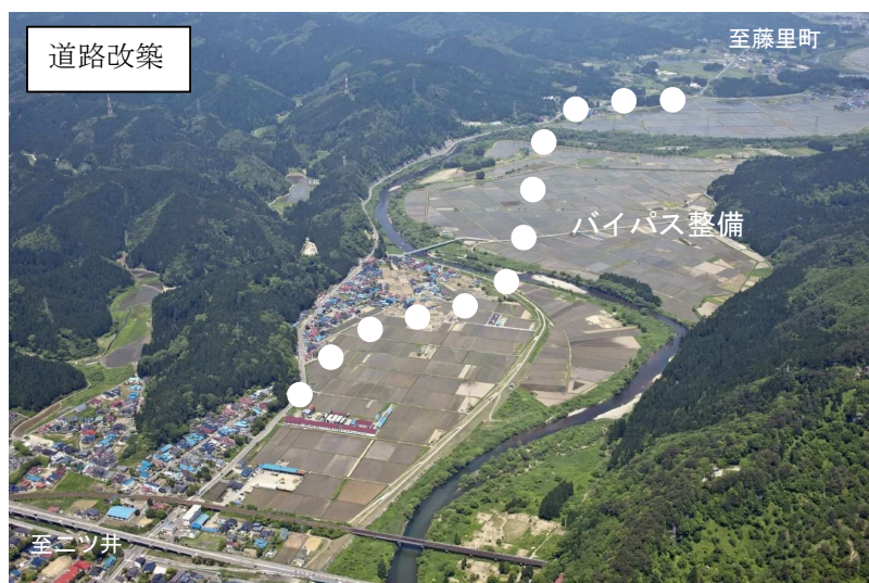
西目屋二ツ井線 荷上場バイパス工区（能代市、藤里町）