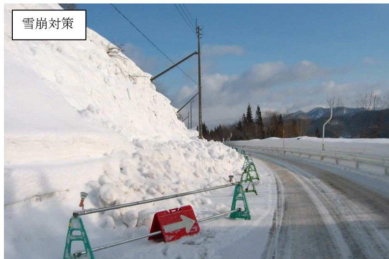
国道341号 玉川工区（仙北市）