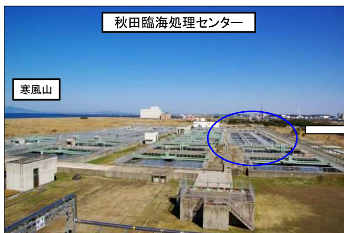
水処理能力増強（反応槽・最終沈殿池）