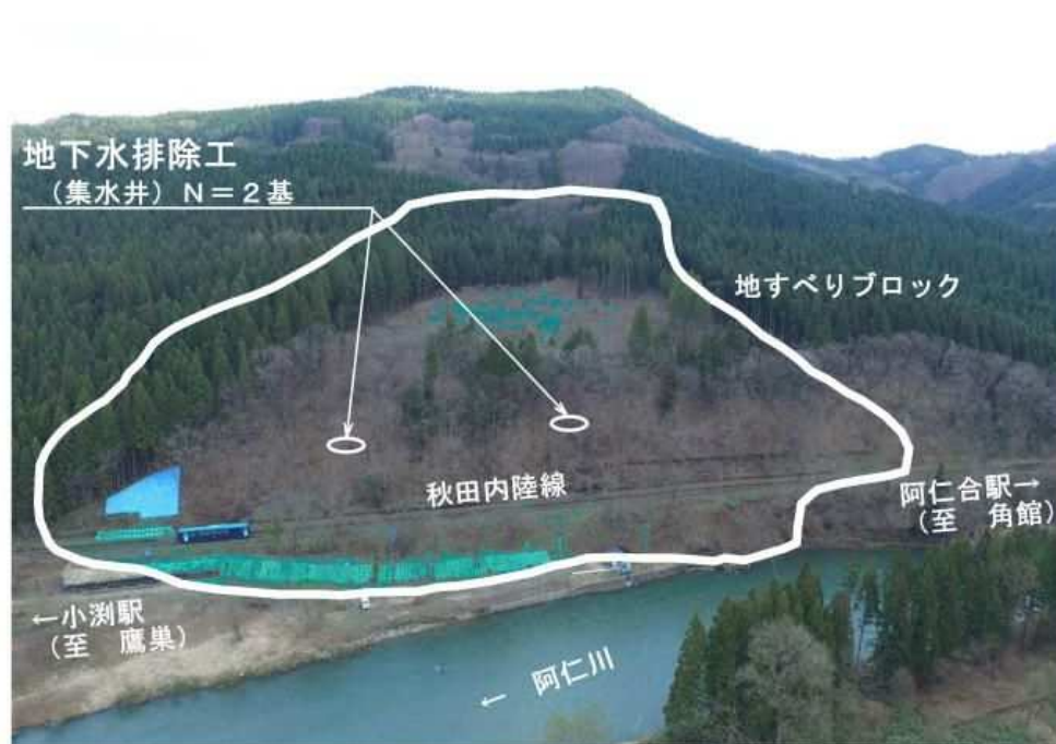
地下水排除工 小淵地区（北秋田市）