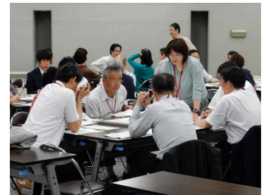
熱心に話し合うグループ