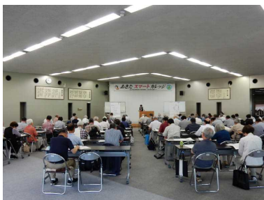
講堂いっぱいの聴講者

受講者からは「めりはりのある説明で聞きやすかった。資料も分かりやすい」等の意見が寄せられました。