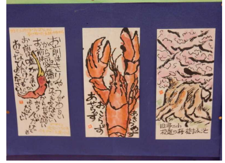
県生涯学習センター玄関展示ホールでの「こもれび工房」絵手紙展より