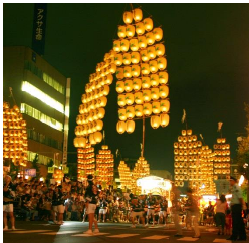
秋田の竿燈(イメージ)