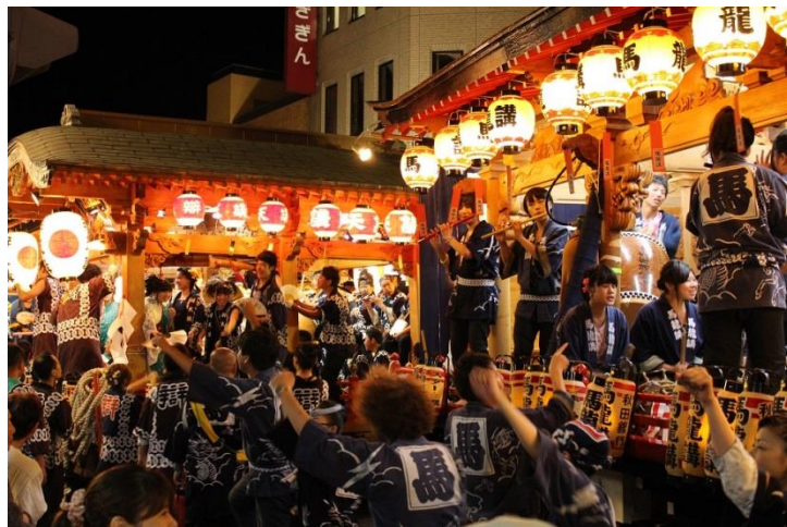
大館神明社例祭の曳山車行事(イメージ)