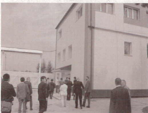
ハバロフスク (日揮事業所前・7/16) ビジネスチャレンジ事業訪問団と同一行動