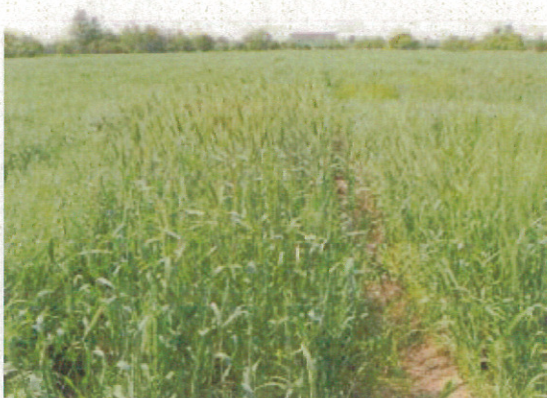
麦類選抜圃場にて（7/17）