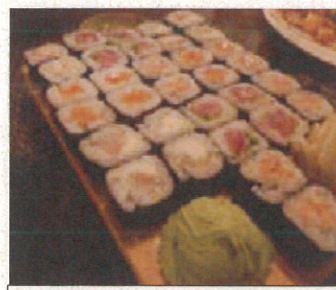
現地レストランの寿司

ただ一方で、ウラジオストクは世帯年収が600万円程度の世帯が1割程度あり所得も向上していることを考えると、今後さらに本格的な日本食レストランが増えて日本食の普及も進み、またコンテナ航路開設などで日本米の輸出コストなども下げられれば将来的には可能性のあるマーケットだとも期待しています。