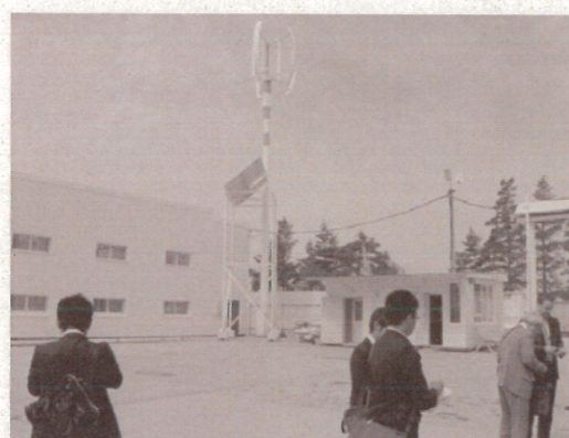
同左の事業所見学中 (7/16) 同左