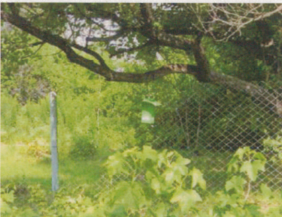
防虫対策用のトラップ（果樹研） グリーン色の箱がトラップ