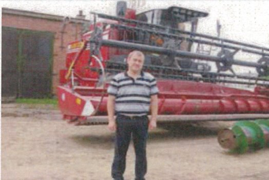
コンバイン（ホイール型）前に立つ代表