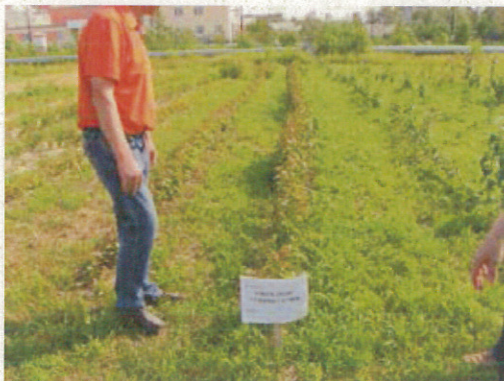
品種改良の選抜圃場（果樹研） （自然交配からの選抜）