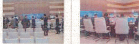
ルースキー島 極東連邦大学B棟