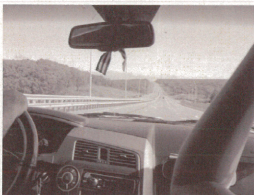
車窓から (7/15) (ロシアに高速道はない)