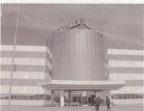
バルティカビール工場前 (7/16) ビジネスチャレンジ事業訪問団と同一行動