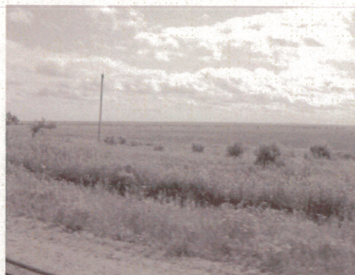
移動中の車窓から (7/15)