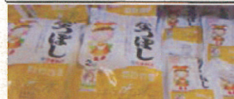
現地で販売されていた 1年以上前の北海道産米

イルクーツク近郊では、1経営体で5000ヘクタール経営の農場を見ることができましたが、日本国内との規模の違いを実感し、単純に日本農業も大規模化すれば世界と戦えると言う話ではない、規模だけではなく経営の成り立たせ方を考える必要があるのだということを感じました。