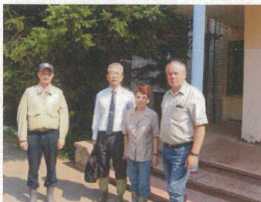
研究所前で（左から、通訳、副所長、部長）