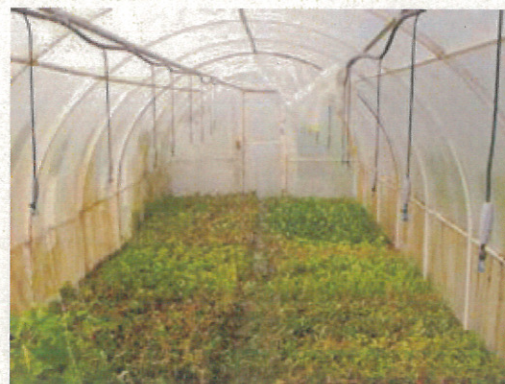
発根検定（果樹研） （室温 35℃、湿度 100%） 発根力の高い品種選抜