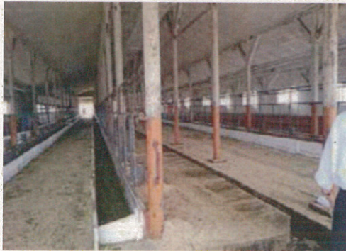
↑写真：牛舎内の風景

この大規模農場は、「コルホーズ」という組織体で作られており、地域の会社という位置づけになっており地域の中心として成長しようとする、経営者の力強さを感じた。