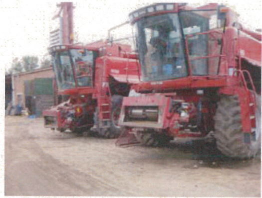
コンバイン（ホイール型）