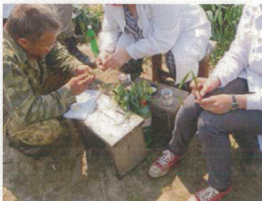
エン麦の花粉採取作業（7/17）