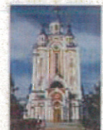
ウスベンスキー教会

まとめ：当組合ではシンガポールを中心に輸出米の生産も行っているのですが、極東地域において輸出米の可能性を探りたく、この度の事業に申込みました。