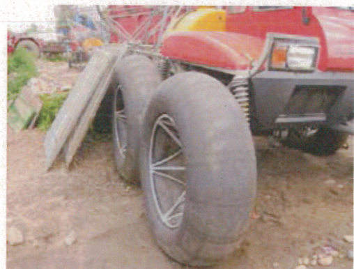
チュウブタイヤを装着した ブームスプレイヤー（時速40km 走行可）