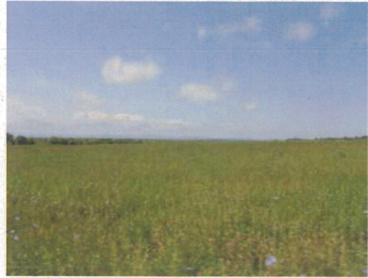
「ピリペンコ」の草地（7/15）