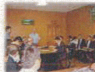
大規模農場【ポリシェランスコエ】にて