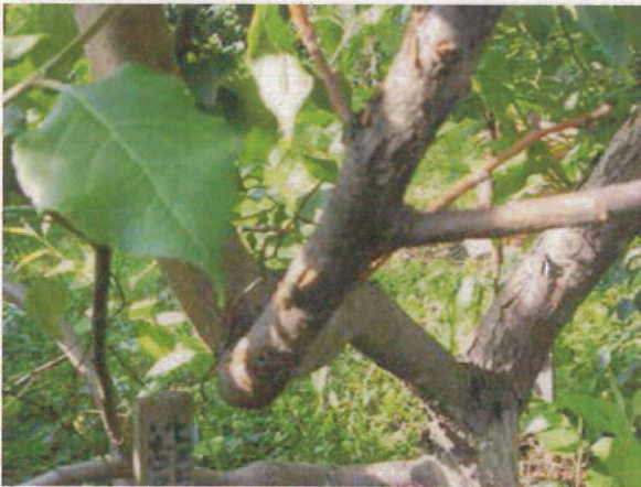
「日焼け症状」枝の肌が荒れた部分 （果樹研） リンゴ樹齢5～6年目に発生が顕著。 他の樹種に比べ樹皮が平滑で、光を吸収しやすいため、とのこと。