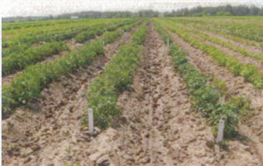
トマト系統選抜圃場