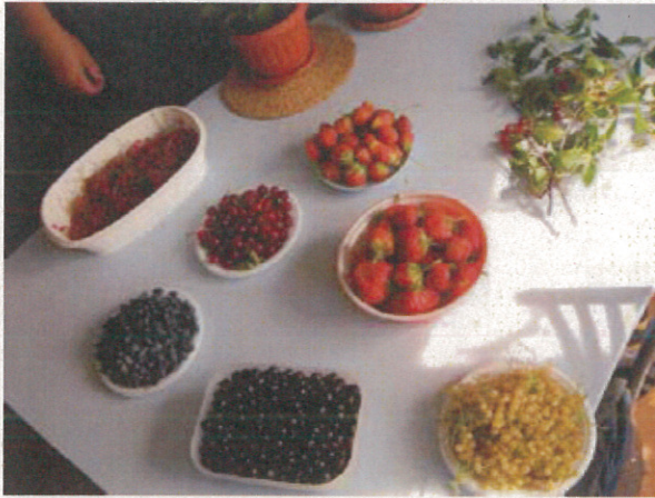
果樹研内ベリー類を試食（果樹研）。 （果肉の大きなイチゴも野生種とのこと）