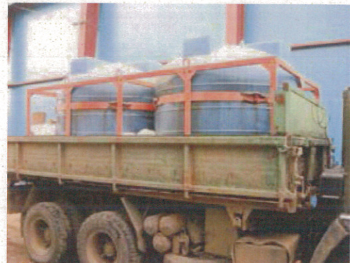
防除用の用水（9 t）と運搬車