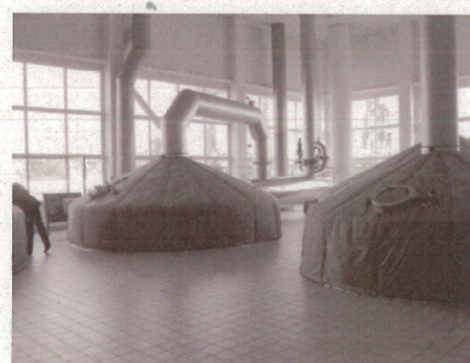
バルティカビール工場発酵装置 (7/16) 同左