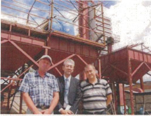
乾燥機（奥）と選別機（フルシート）

エ 穀物選別機（ベラルーシ製 5.0 t / hr） 選別後の大豆は搾油用の他、ウスリスキー養鶏場に出荷 オ 昇降機の設備も改修中（沿海地方補助事業）。 （麦類の本格収穫の8月までには完成予定）。