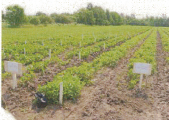
大豆の系統選抜圃場（7/17）