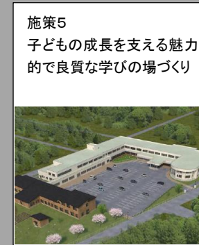
【学校教育を支える環境の整備】