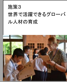
【国際教育・国際交流】