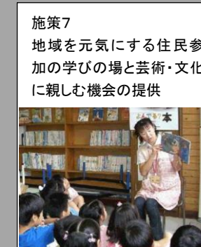
【生涯学習・文化財保護】