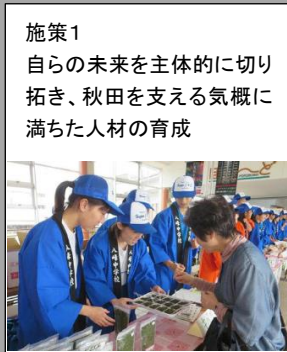
【学校と社会との接続】