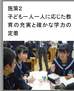
【資質・能力の育成】