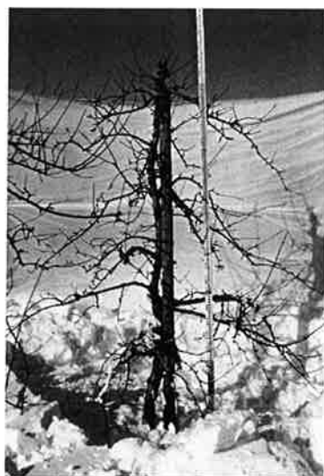
写真1 側枝下垂型主幹形