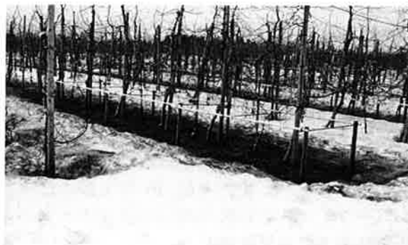
写真2 消雪剤の効果