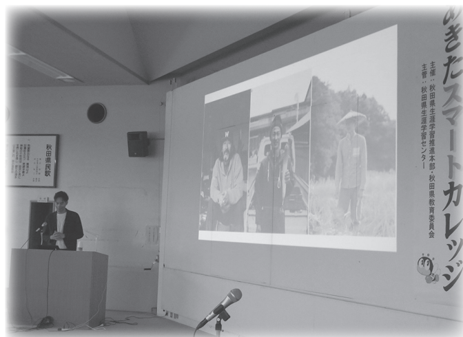
令和4年度の講座の様子

社会の急激な変化に対応し、持続可能な地域を営むヒントが得られるよう、あなたも「あきたスマートカレッジ」で学んでみませんか？