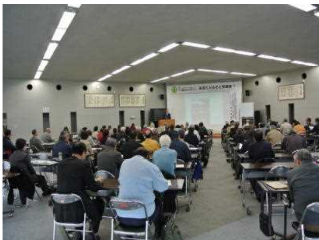
人気講座「地域史を学ぶ楽しみ」の1コマ

平成26年度の美の国アクティブカレッジ「あきたふるさと学講座」も、歴史講座をはじめ魅力あふれる講座を企画しております。学習案内につきましては、今月中に完成予定です。お楽しみに！