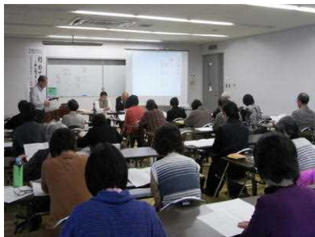
「初めての俳句」の様子