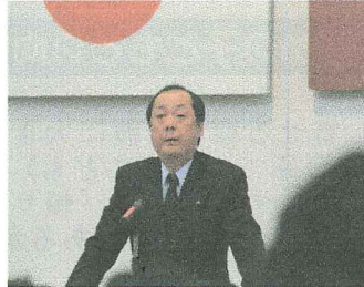
参事(兼)生涯学習課長祝辞