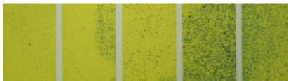
図2 水道水を15L/10a散布したときの感水紙付着状況 注) 平均付着割合 5.5%