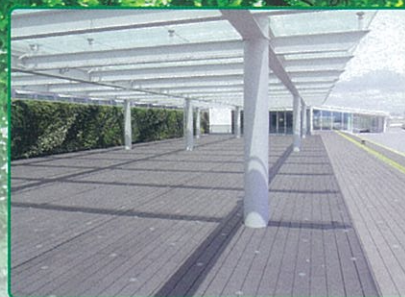
秋田ウッド(株)の製品 「AO-Mウッド」 羽田空港展望デッキ