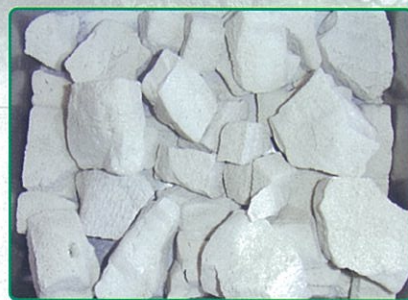
北秋容器(株)の製品 「スーパーソル」

※平成16年10月7日には、国(経済産業省、環境省)から変更計画が承認されました。